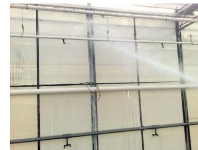
Glas reinigen met schuimondersteuning