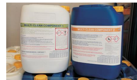
Twee componenten voor meer stabiliteit